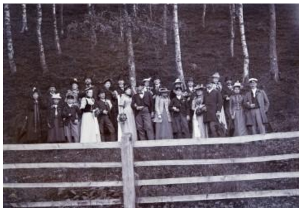
Foto från bröllopet