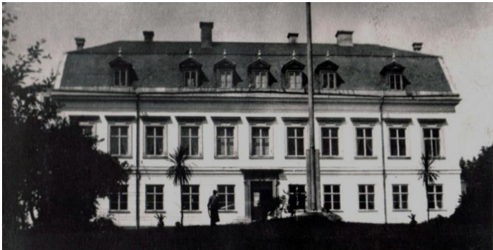
Ådö – södra fasaden före ombyggnaden

Ombyggnaden är omfattande – Milles’ beskrivning av den upptar 20 tättskrivna A4-sidor – men kostnaden har jag inte hittat.