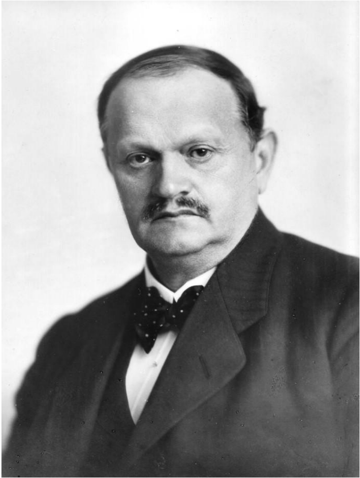
Ernst Malmström 1862–1935